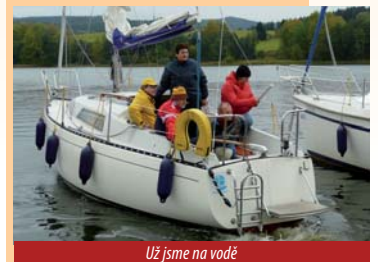
Už jsme na vodě