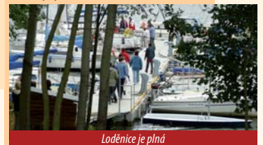
Loděnice je plná

na jachtách. Zážitek je dokonalý. Právě propojení našeho hotelu s okolní přírodou nabízí neuvěřitelné možnosti a agentury se předhánějí, co která vymyslí. Ze školení, seminářů a kongresů si chce každý odvést zážitek. To u nás není rozhodně problémem. Nabízíme širokou škálu možností – odpočinek ve wellness a spa centru, outdoorové i indoorové sporty. Navštivte naše stránky, přesvědčte se sami.