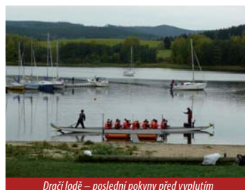
Dračí loď – poslední pokyny před vyplutím