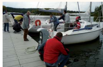
Hotelové molo – příprava účastníků semináře na dalekou plavbu